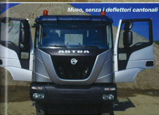
Muso, senza i deflettori cantonali

merose alettature e nervature che nell'off road s'intasavano di fango e acqua che permaneva in maniera persistente, creando così dei gravi problemi di usura. Oggi il guscio presenta invece forma più regolare e 'pulita'. Sono infine disponibili anche le versioni off road del robotizzato Zf AsTronic e dell'automatico realizzato da Allison.