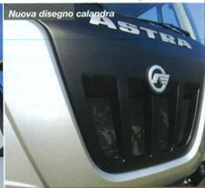
Nuova disegno calandra