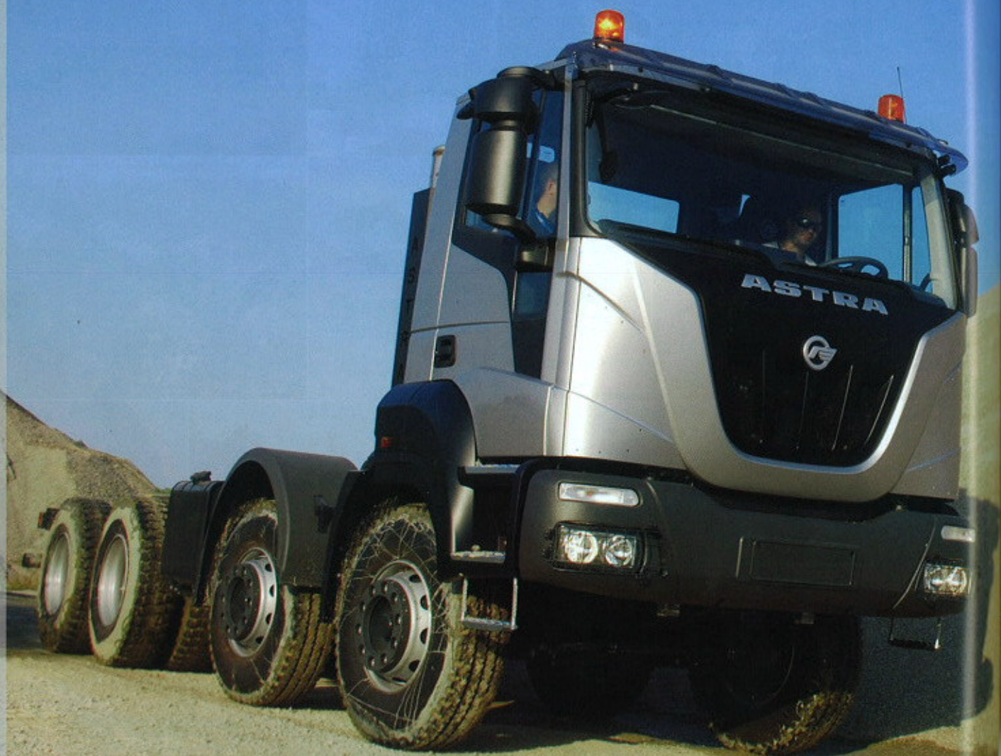
Vista laterale passeggero