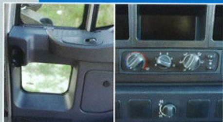
Da sinistra, l'oblò sulla portiera e il controller del clima

mi due gradini e dal doppio maniglione verticale su ambo i lati della portiera. Tutte le misure dell'abitacolo, sono state modificate. La profondità è cresciuta di 30 millimetri, l'altezza interna di 60, dato che si è dovuta compensare la diminuzione del tunnel di 70 millimetri, migliorando i deficit di mobilità dell'Hd8. Una volta seduti sui nuovi sedili (pluriregolabili e con cinture di sicurezza integrate), balza all'occhio la rinnovata grafica del cluster strumenti e comandi autoradio posizionati tra le razze del volante panciuto. Sparisce la console centrale trapezoidale in ragione di una forma piatta che è dominata al centro dall'unità del climatizzatore (comandi e bocchette), mentre alla base va il selettore per il bloccaggio dei differenziali. Molto più economica la leva del cambio, ora più bassa rispetto alla precedente. Tutti i pannelli sono stati migliorati nella composizione e nell'assemblaggio (minori vibrazioni e miglior isolamento acustico). I pannelli portiera sono adesso più ergonomici e sono stati mantenuti gli oblò nella parte inferiore della porta, utili nei passaggi stretti e con poca visibilità inferolaterale. A richiesta sono disponibili gli specchietti retrovisori regolabili elettricamente e raddoppiano gli altoparlanti per godere della musica anche nel fragore della marcia in off-road.