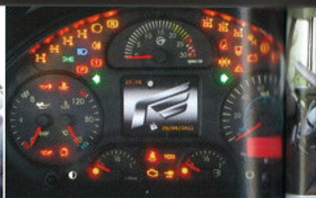
Grafica inedita del cluster