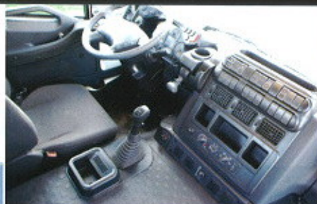
Nuova plancia con tunnel più basso